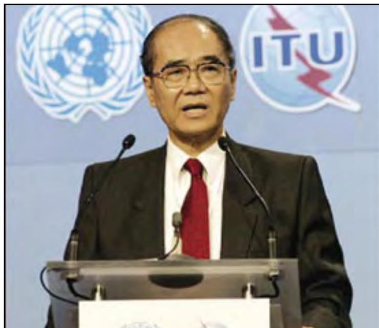
Koichiro Matsuura, Director General di UNESCO ta duna un discurso durante e di cuatro sesion di e Cumbre Mundial riba Sociedad di Internet.

TUNES—E cumbre Mundial riba Sociedad di e Informacion CMSI, di Tunes ayera a aborda iniciativa tecnologico pa corta distancia entre inforricos” y inforricos”, como un ordenador na prijs di costo, cu e talon atras di denuncia di violacionnan na e libertad di expresion.